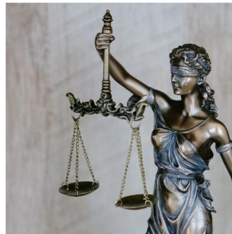
Δικηγόροι / Δικηγορικά Γραφεία